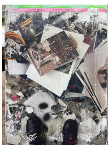
Chez Le Guen, 2023

En procédant ainsi, le sujet devient aussi important que la matière. L'esthétique populaire tirée des pages de beaux-livres surgit par moment, rendant la toile quelquefois étonnamment familière.