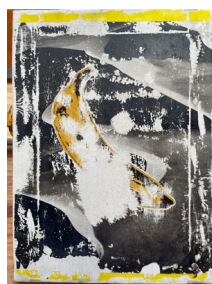
Dessert chaud, 2023