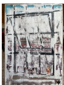
Mer rouge, 2023