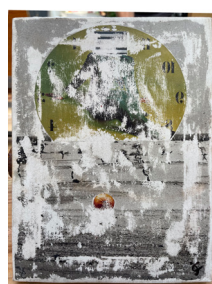
Orange mécanique du temps, 2023