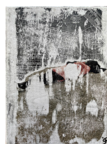
Corps en projection géométrique, 2023